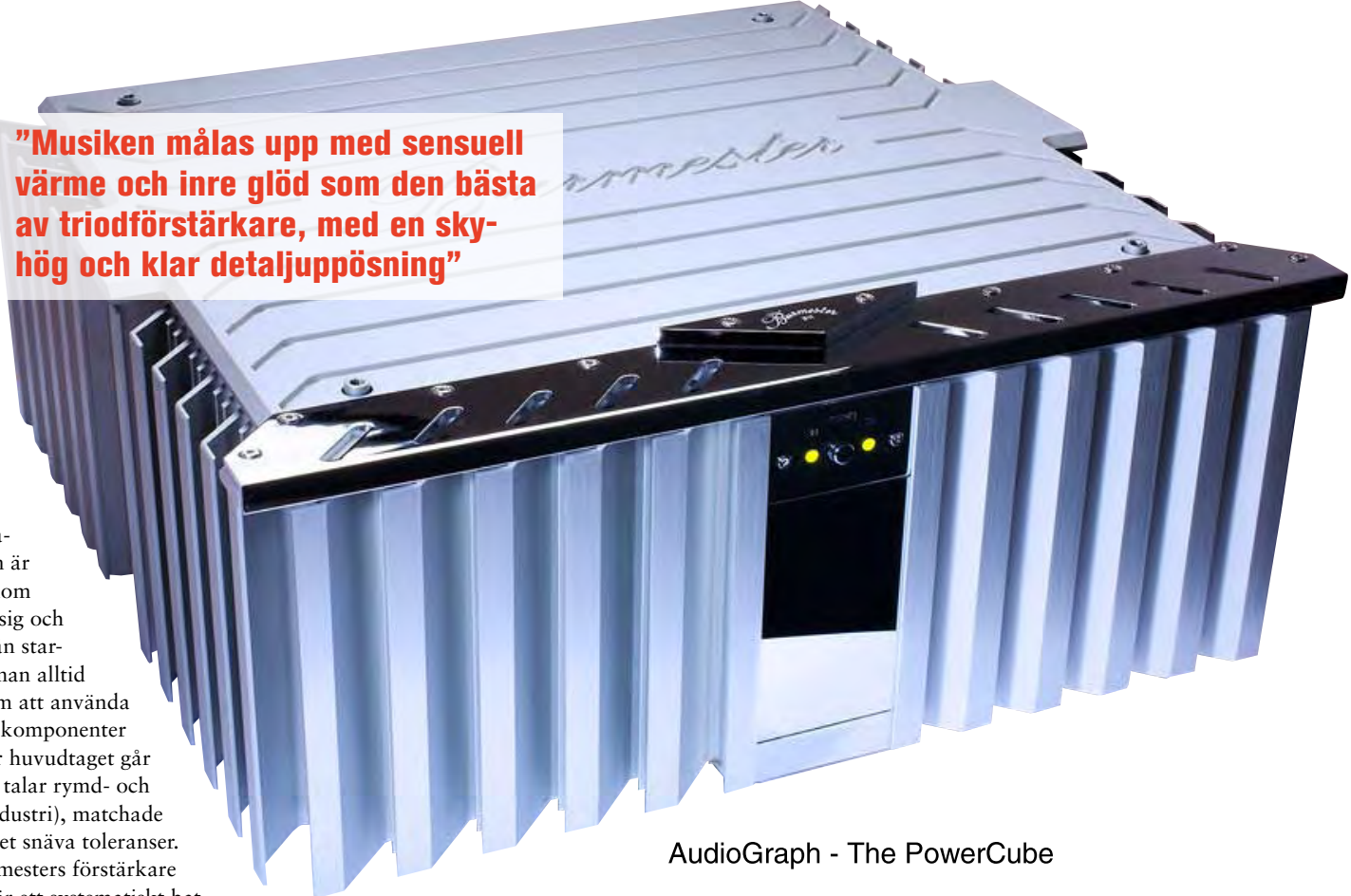
AudioGraph - The PowerCube

Amplifier : Burmester Power Amp 911 Serial No : 562041 MK 3 Owner : Place / date : Hifi & Musik / 1/31/2008 User : MF Rated Power : 350 W at 4 ohms Voltage : 230